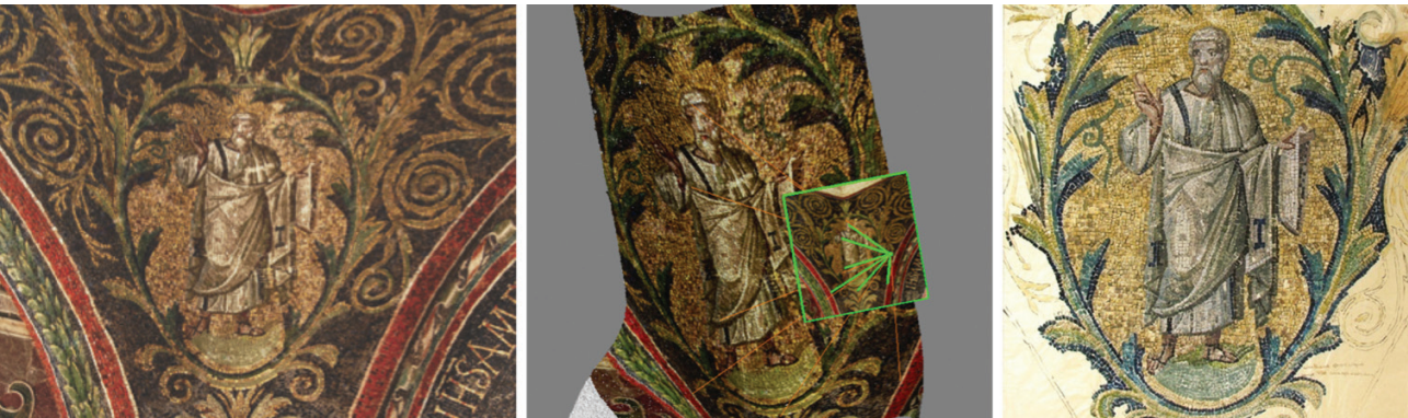
Figura 2. Il rilievo dei mosaici alla scala architettonica (immagini di decorazioni musive presso il Battistero Neoniano e cartone preparatorio a tempera su carta da lucido, realizzato da Libera Musiani, in occasione della campagna di rilievi pittorici e tramite calchi in gesso effettuati prima del restauro del 1937).